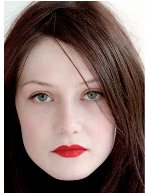
Carice van Houten, 2001

De Kunsthal Rotterdam presenteert met meer dan tweehonderd foto's een groots retrospectief van Nederlands bekendste fotojournalist Vincent Mentzel. Als staffotograaf bij NRC Handelsblad heeft hij in veertig jaar een krachtig oeuvre opgebouwd. Het overzicht laat vier decennia nieuwsmomenten zien met beelden die op ieders netvlies gebrand staan. Mentzel zelf vertelt in de tentoonstelling over zijn favoriete foto's en wat zich op het moment van opname buiten het oog van de camera afspeelt.