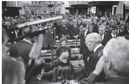
Koningin Beatrix, 1986