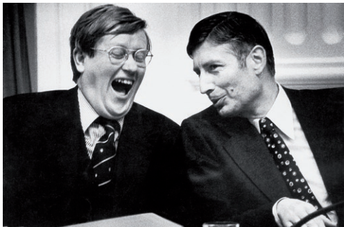
Wiegel en Van Agt, 1978